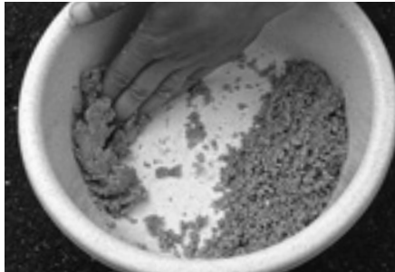
エサボウルの縁に擦り付けるように数回繰り返します