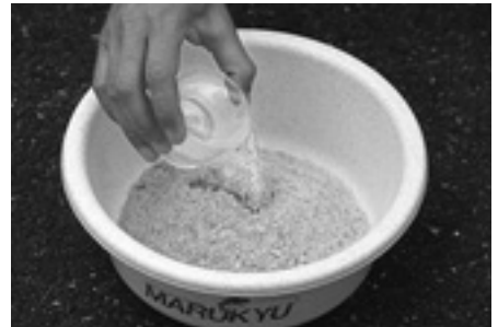
② 次に水1カップを加えます