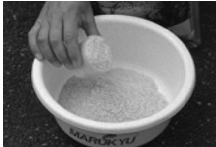
① 「パウダーベイトヘラ」を計量カップですり切り5カップ計り、エサボウルなどの容器に入れます

適度なネバリがあるのでまるめやすく、エサ付けが簡単です。エサの練り加減やハリ付けの大きさ次第で幅広いタナに使用できます。また、セット釣りのバラケにも対応します