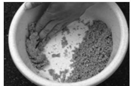
④エサ持ちの状態をキープするために、エサボウルの縁に擦り付けるように数回繰り返します