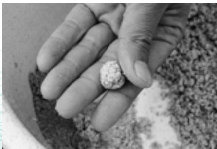
⑦ 直径15mmくらいの大きさにまとめ、ハリ付けします