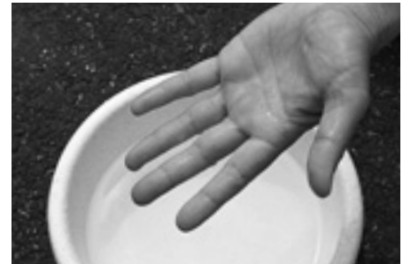
②手が十分に濡れている状態、これが手水です