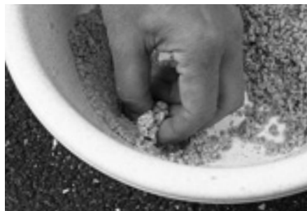
⑥ 使う分量のエサを取ります