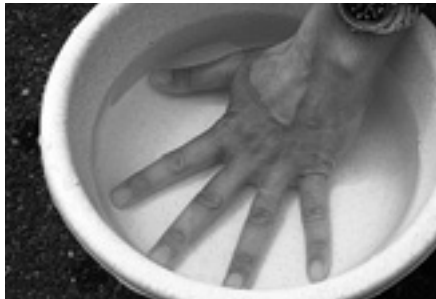
①エサボウルなどに取った水に手を浸します