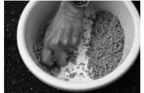
もうひとつの練り方として、エサを握るように繰り返します