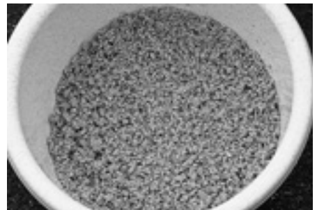
④ 基エサのできあがり