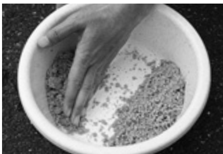
③使っているエサに手水をなじませます