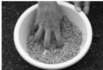
③ 水を加えたら全体的にムラがないように混ぜます。このとき、手を熊手状に開くと均一に混ぜ合わせることができます