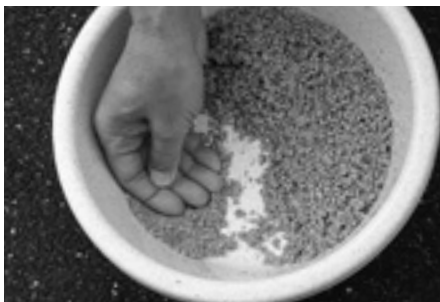
⑤ 基エサを小分けして、空気を抜くように押し練ります