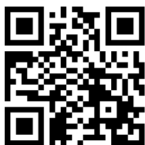
大会申込先QRコード

【申込先】MFG本部事務局 〒363-8509 埼玉県桶川市赤堀2-4 マルキュー(株)内 TEL 048-728-0909 / FAX 048-728-3909 問い合わせメールアドレス： info@marukyufangroup.com